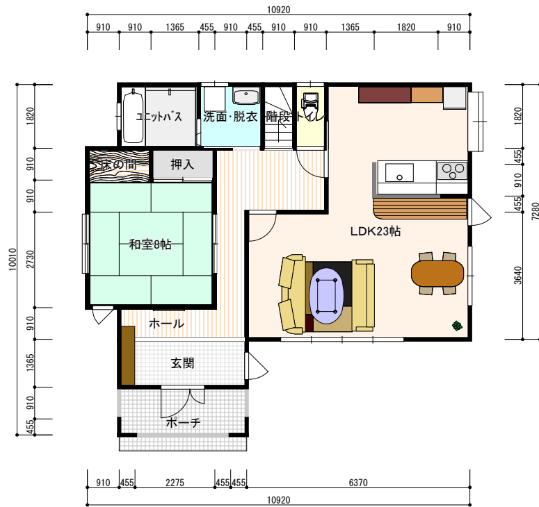
1 F プラン